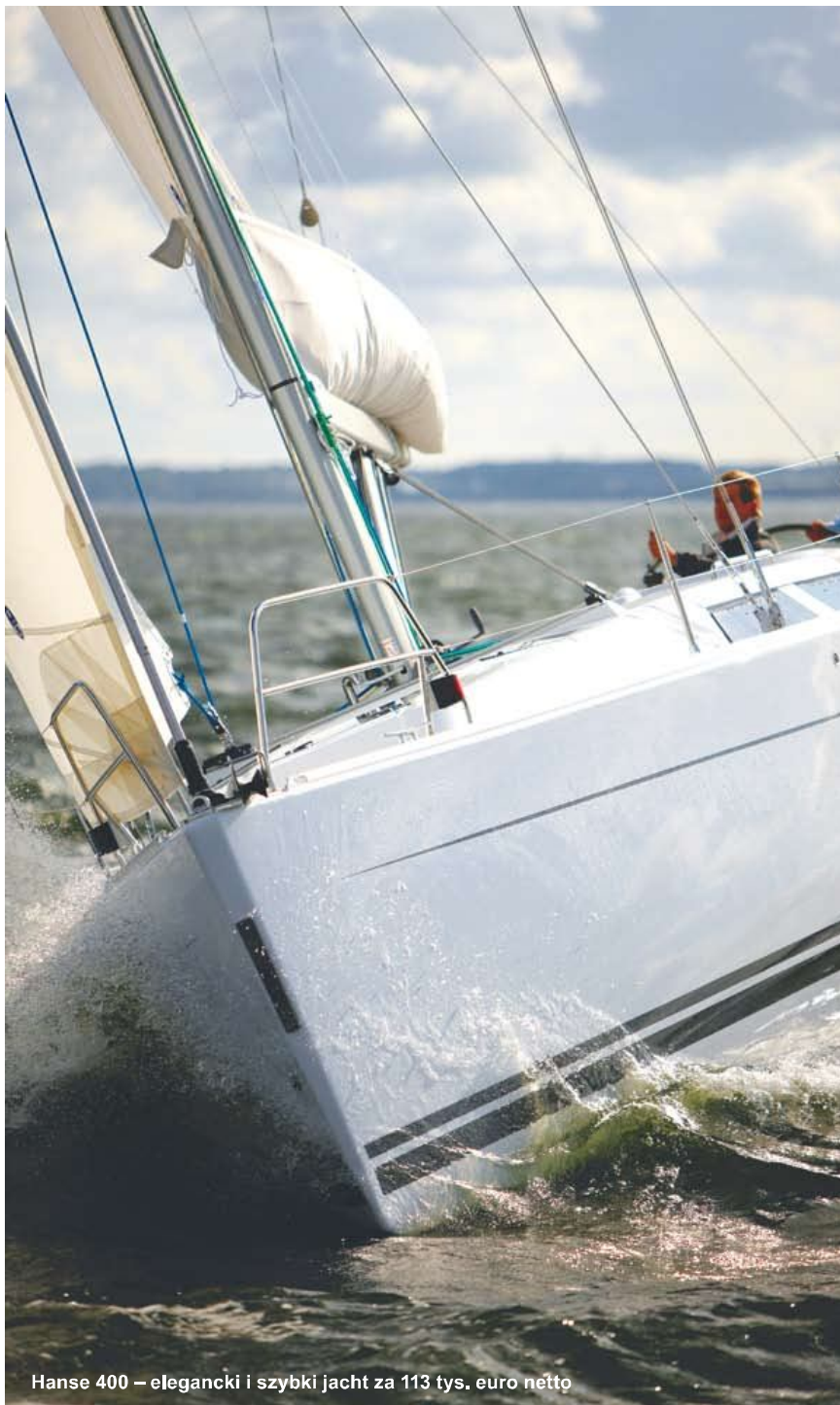
Hanse 400 – elegancki i szybki jacht za 113 tys. euro netto

Hanse 400 na długi rodzinny rejs lub morskie regaty