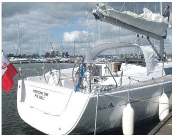
„Horizont One” przy kei w Szczecinie.