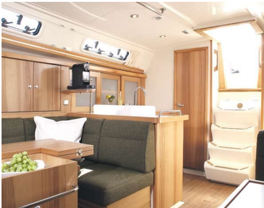
W salonie znajduje się rozkładany stół jadalny.

Kanapa przy dużym stole oraz fotele przy stole nawigacyjnym tworzą całość. Załoga może zasiąść do wspólnej kolacji i nie musi się znajdować blisko siebie, ramię w ramię na jednej burcie. Światło wpada do salonu przez boczne okna oraz przez dwa otwierane luki na suficie. Odpowiednią temperaturę i wentylację zapewnia urządzenie firmy Eberspächer.